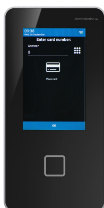
KABA TERMINAL 96 00

Dialogen sættes op i ProMark og afspejler derfor virksomhedens eget sprog og termer. Den kan styres per medarbejderkategori for optimal dataopsamling.