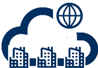
ProMark 365 Cloud

I køber altså brugsretten til ProMark som initial investering med en mindre løbende omkostning til vedligehold.