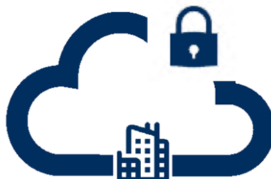
ProMark Private Cloud