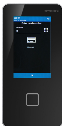
KABA TERMINAL 96 00

Dialogen sættes op i ProMark og afspejler derfor virksomhedens eget sprog og termer. Den kan styres per medarbejderkategori for optimal dataopsamling.